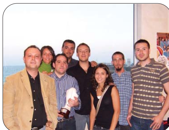
Y en la 2007/08, Sucampeones en Senior Preferente.