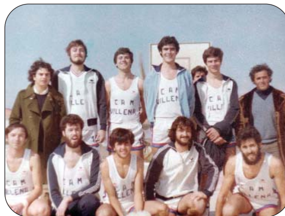
Y éste fue el equipo en 1978.