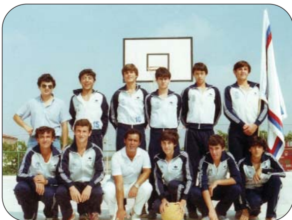
Equipos Junior y Juvenil en la temporada 79-80.