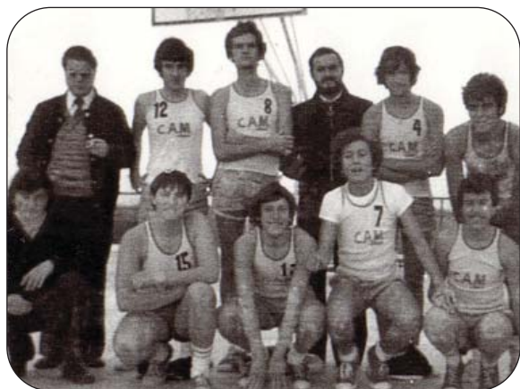
El equipo en 1975.