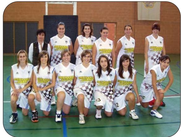
Senior Femenino Preferente.