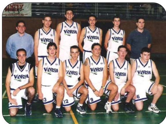
Equipo Junior 2001-02.