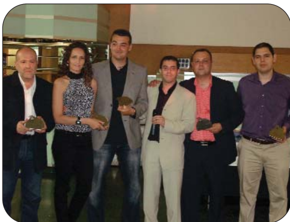
Despedida de la anterior Junta Directiva durante el evento.