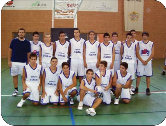
Cadete Masculino "B".