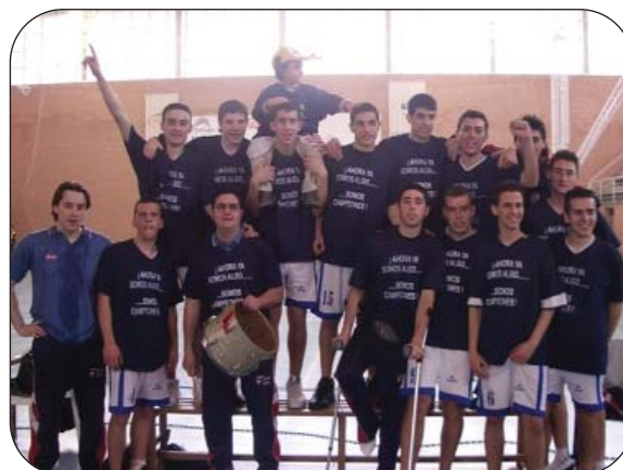
Y aquí en el año 2005.