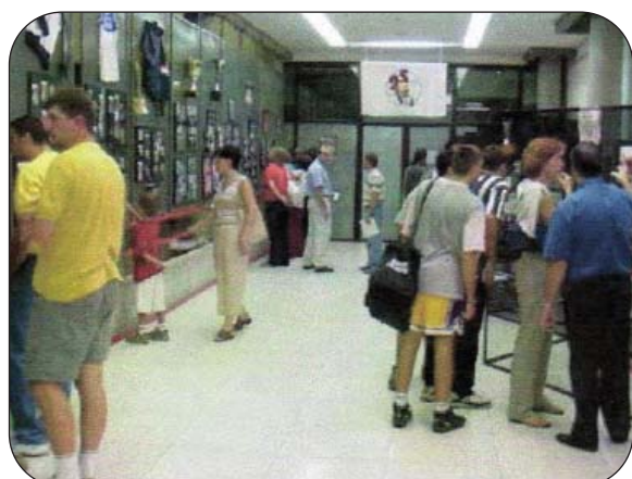
Otra imagen de la exposición.