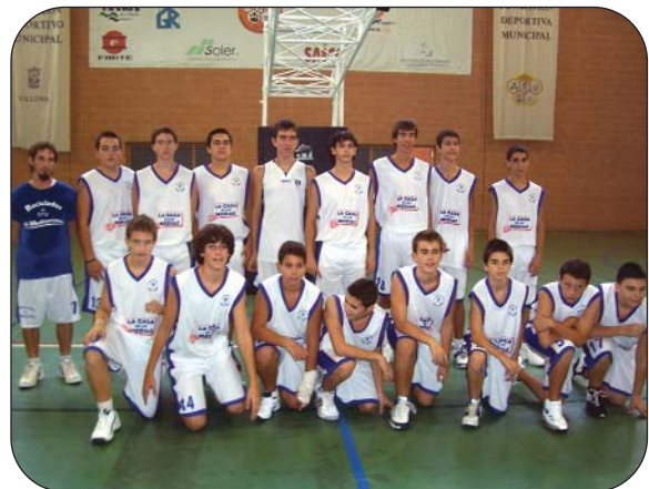
Cadete Masculino "A".