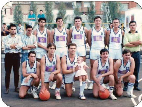
Equipos Senior y Cadete de la temporada 1988-89.