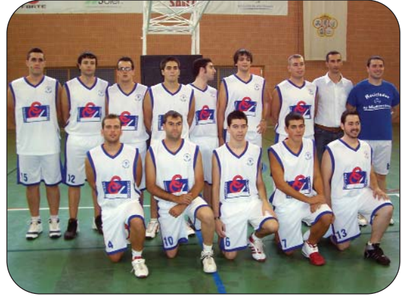
Senior Masculino Primera Zonal.