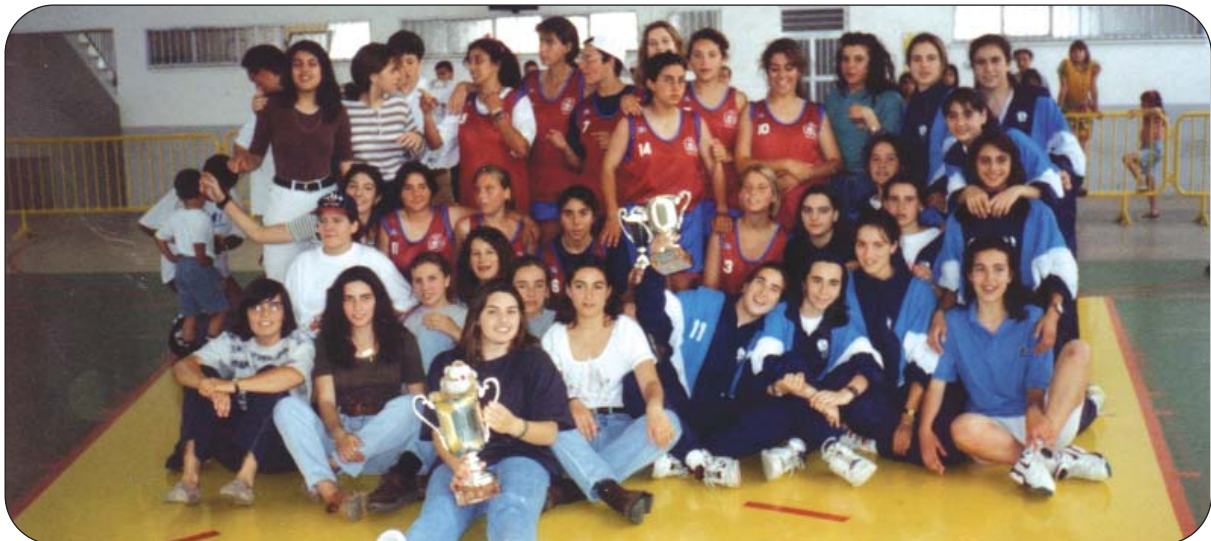
El equipo Juvenil Femenino se proclamó Subcampeón Provincial en la campaña 1993-94.