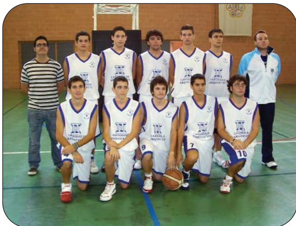
Junior Masculino Primera.