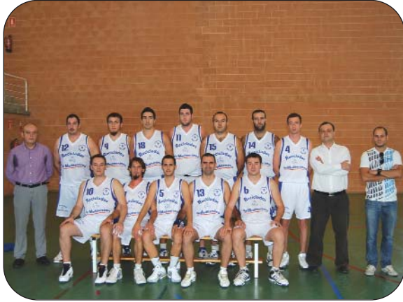
Senior Masculino Preferente.