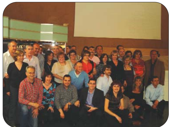
Simpatizantes, padres y colaboradores del V-74 Villena.