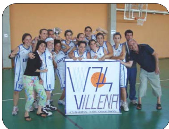
Las Cadetes, campeonas provinciales en la temporada 2006/07.