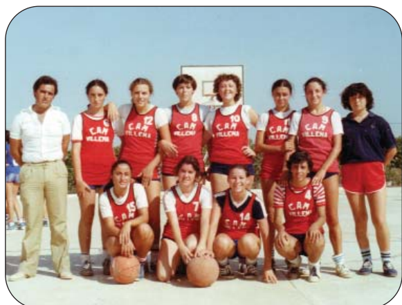
Los primeros equipos femeninos del V-74 Villena.