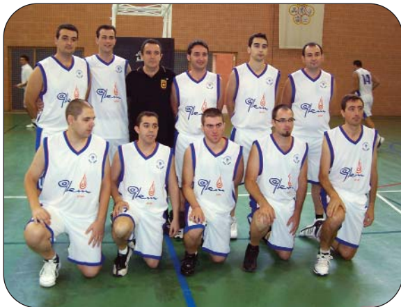
Senior Masculino Segunda Zonal.