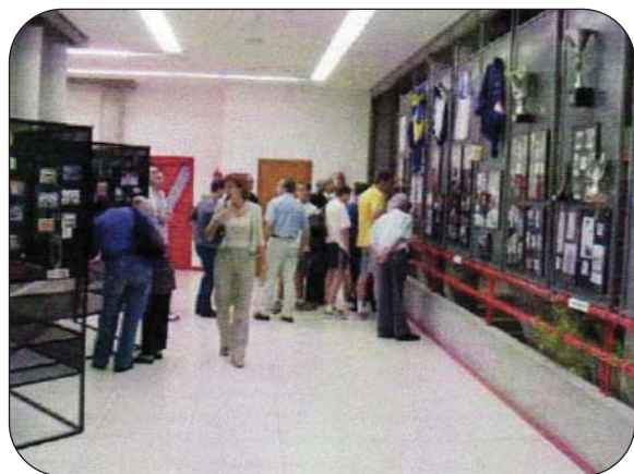
La exposición de fotografías congregó a mucha gente.