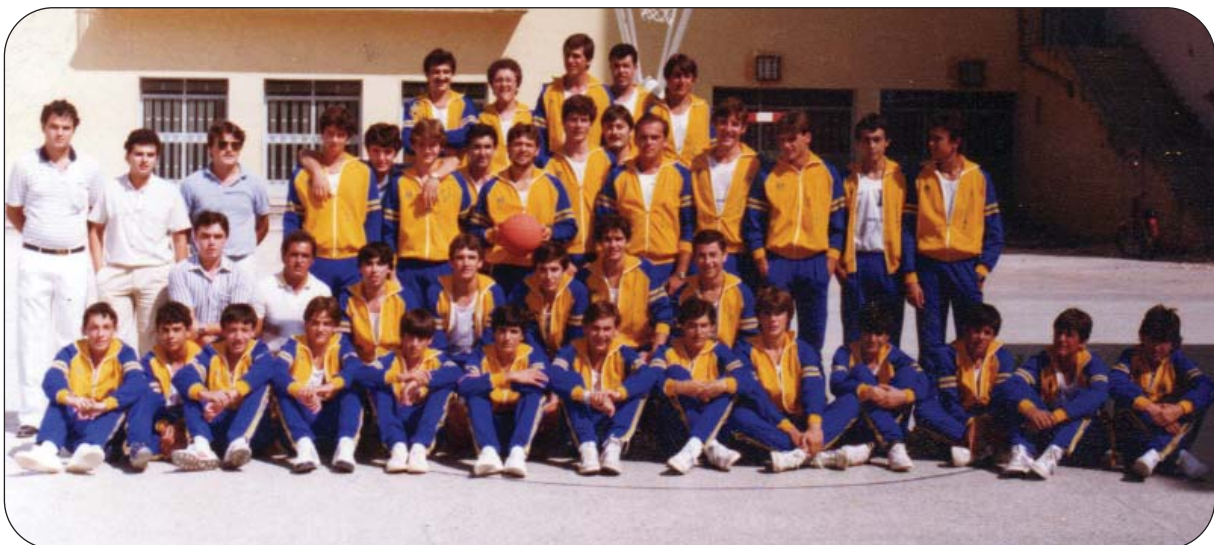
Primera temporada como Club Baloncesto V-74 Villena.