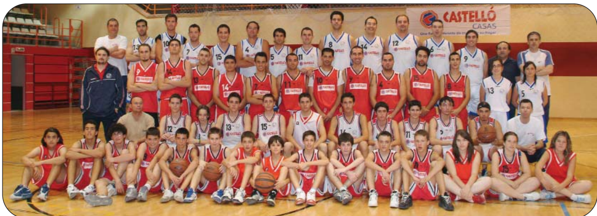
Los jugadores/as del C.B. Aspe han ido creciendo a todos los niveles, formando un Club unido e ilusionado.