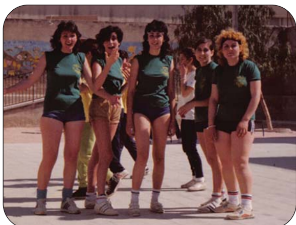
También se generó una afición entre las chicas, formándose los primeros conjuntos femeninos.