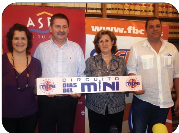
Presentación de la Supertapa Orange.

El C.B. Aspe celebra siempre numerosas actividades para los más pequeños, y entre ellas hay que destacar la Etapa nº 13 del Circuito Días del Mini 2008-09 , que fue acogida por la localidad, escenario también de una de las Supertapas Orange del Circuito, con algunos de los mejores equipos de la provincia. La apuesta del Club por los más jóvenes es una realidad.