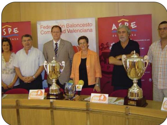
Presentación de la Lliga Valenciana 2007.