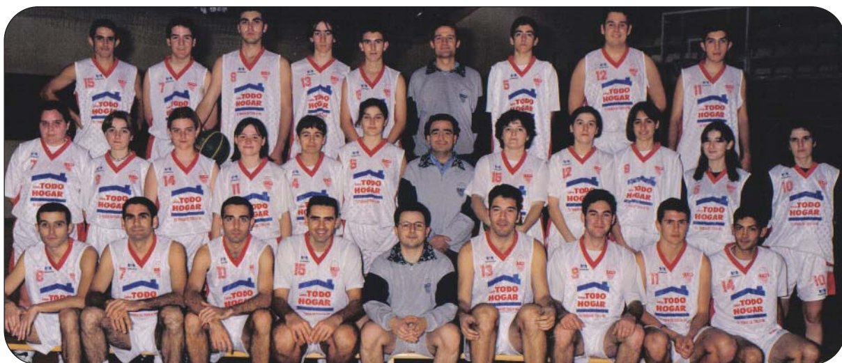
El C.B. Aspe en los inicios de la década de los 90.