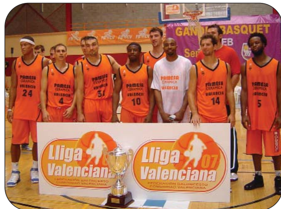
El Valencia Basket se proclamó campeón.