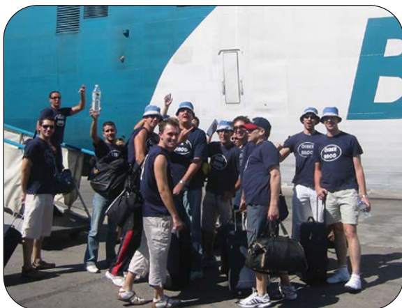
Y tras los éxitos, Ibiza.