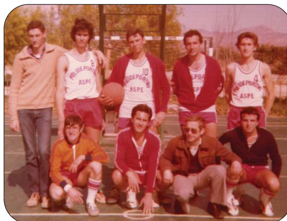
Los primeros equipos del Club Baloncesto Aspe.