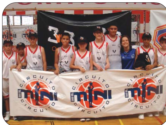
El C.B. Aspe Alevín se lo pasó en grande.