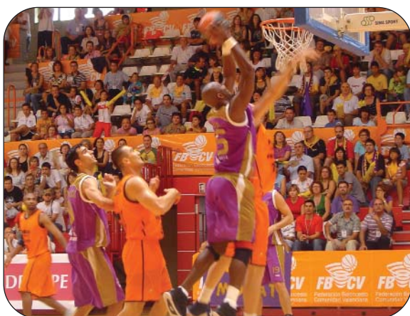
Algunas imágenes de la Final, disputada en el Pabellón de Aspe.