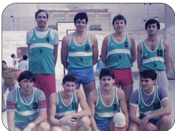
Los equipos masculinos iban creciendo en el seno de la entidad.