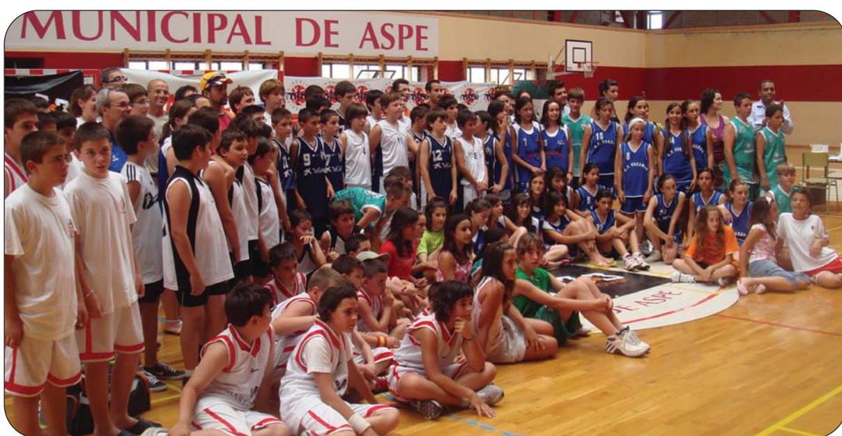
Foto de familia.