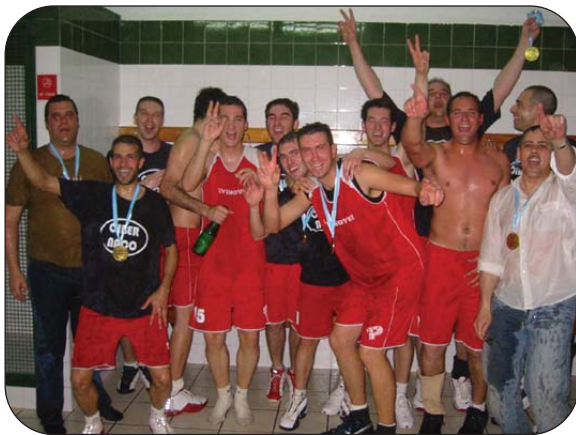
Éxitos por segundo año consecutivo. El ascenso era una realidad.