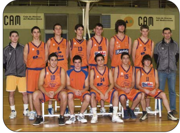
Plantilla Junior Masculino Preferente