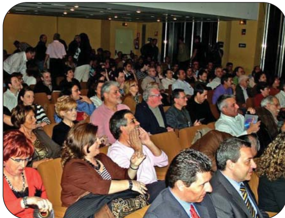
La sala donde se celebró el acto estaba repleta de aficionados.