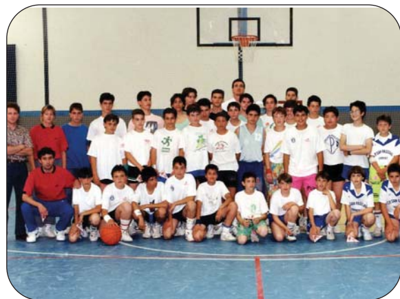
El trabajo con los más pequeños empezaba a dar resultados.