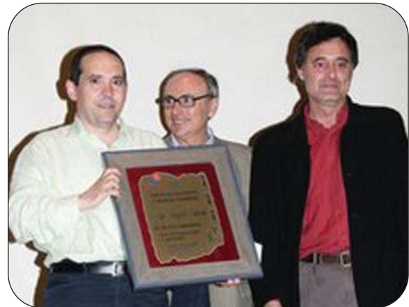
La FBCV no quiso perderse la cita y dio su particular homenaje.