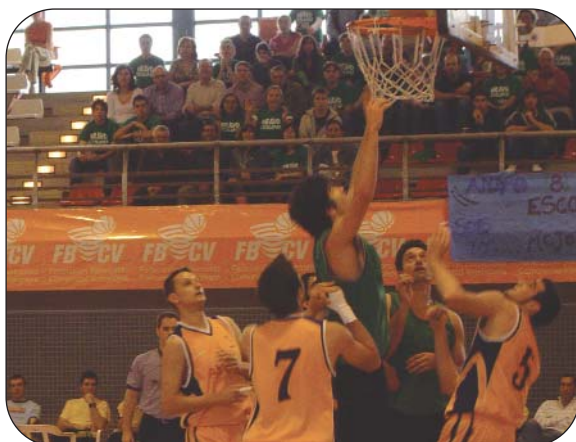
El 3º y 4º puesto y la Final mantuvieron la emoción hasta el último momento.