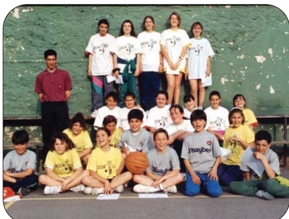
En su primera década, el club sí contó con un equipo femenino.