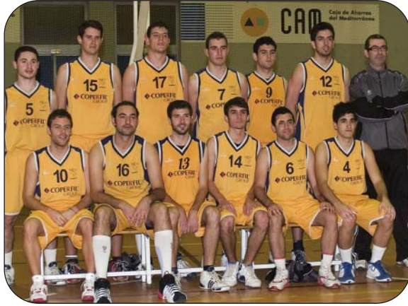
Plantilla Senior Masculino Preferente