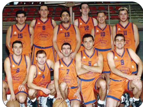
El color naranja comenzó a ser identificativo de la entidad.