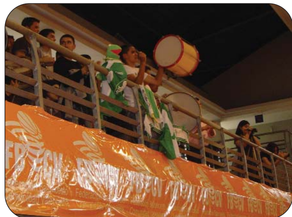
La afición disfrutó del gran juego desplegado por los equipos.