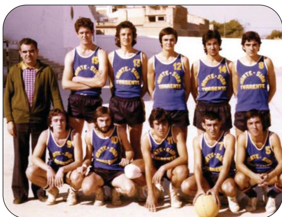
Éste es el primer equipo que entró en competición (T. 72-73).