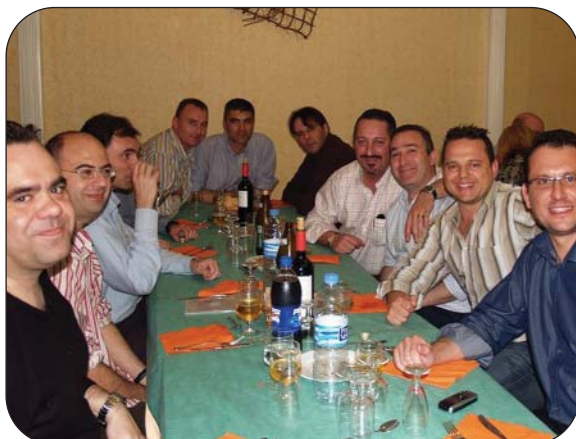
Todos los simpatizantes de la entidad se reunieron después para evocar los buenos momentos pasados.