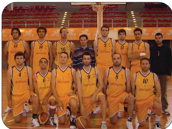
El equipo que luchó en la Fase Final por el ascenso a 1ª DM.