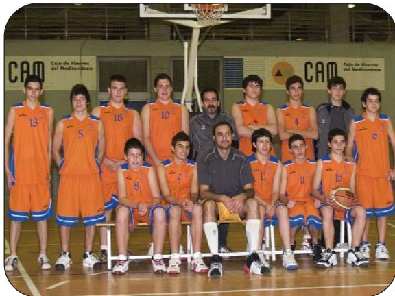
Plantilla Cadete Masculino Nivel Promoción 1