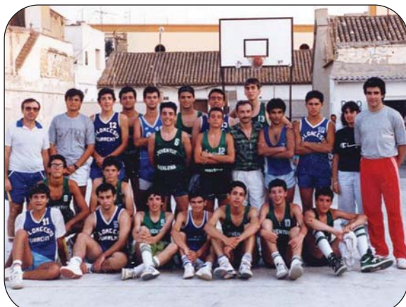
La visita de las promesas del Joventut llevó la ilusión a los jóvenes.