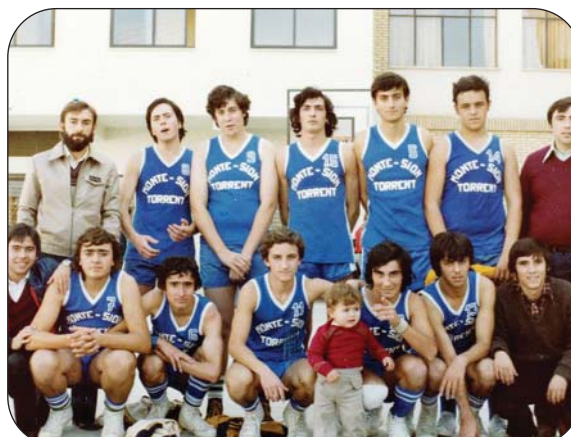
En 1979 la consolidación del club era toda una realidad.