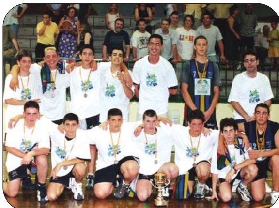
El equipo Cadete que luchó por el ascenso a Autonómica.