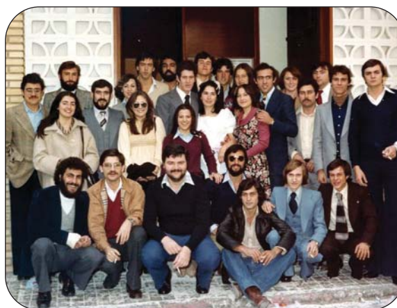
Cualquier celebración servía para unir a todos.