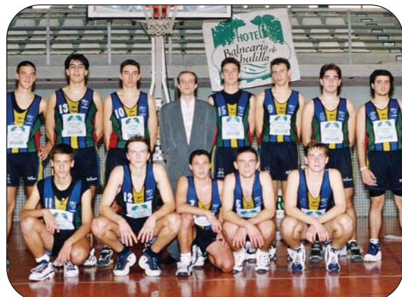
El primer equipo de la entidad en 1998.