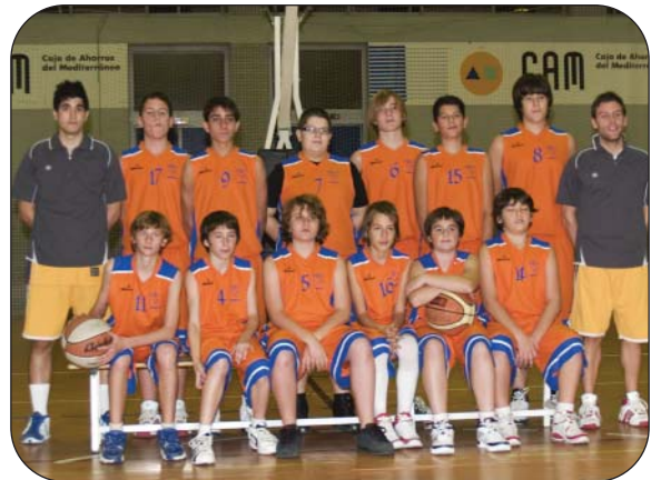
Plantilla Infantil Masculino Nivel Promoción 1